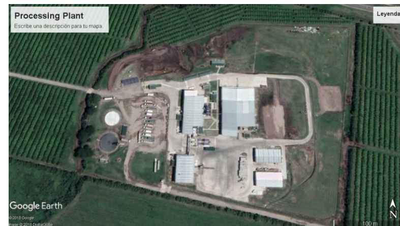
Argenti Lemon Processing [metric Tons]